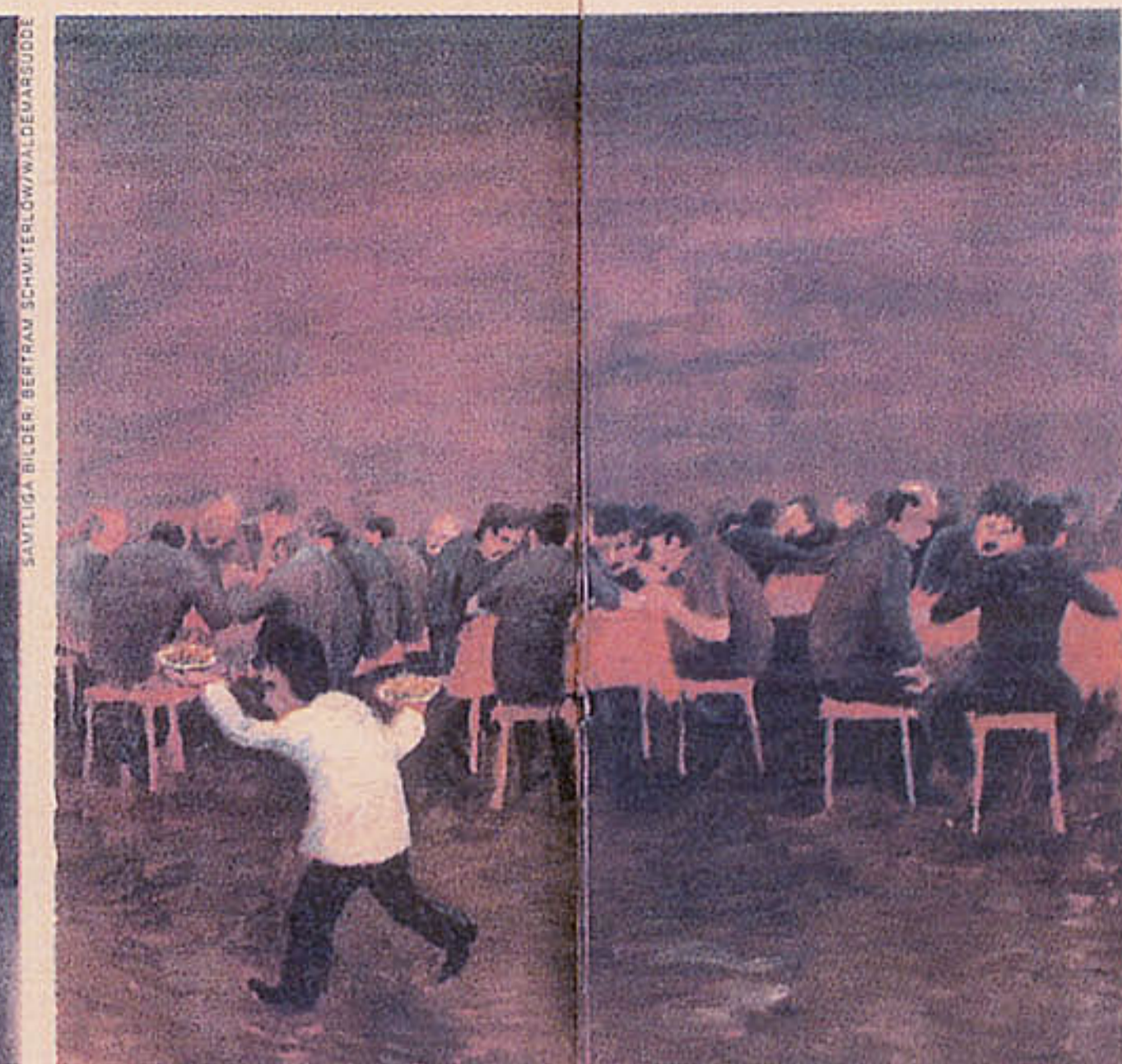
Ätarna. Människans behov, som att äta, spelar huvudrollen i många av Schmiterlöws bilder.